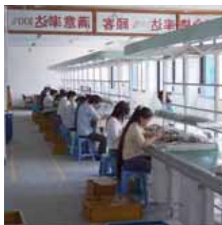
Una línea de producción de falsificaciones

Las falsificaciones no aportan ninguna garantía de calidad y de seguridad a los clientes. Estos productos pueden ser resultado de un diseño peligroso, incluir componentes de materiales inapropiados o de mala calidad, y no haber sido sometidos a los controles pertinentes. Incluso en muchas ocasiones únicamente se mantiene la apariencia exterior y las funciones básicas han sido suprimidas para reducir costes.