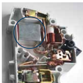
Una copia de interruptor automático Hager con una cámara de corte de acero macizo