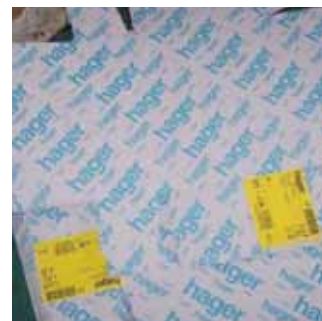
Copias de embalajes Hager