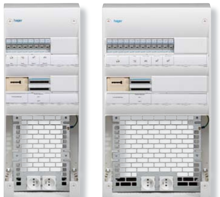
Le coffret Nodeis a été conçu par Hager en différentes configurations pour s'adapter à tous les besoins.

De plus, il rend les espaces de vie plus flexibles en permettant aux équipements multimedia de se connecter sur un seul et même type de prise.