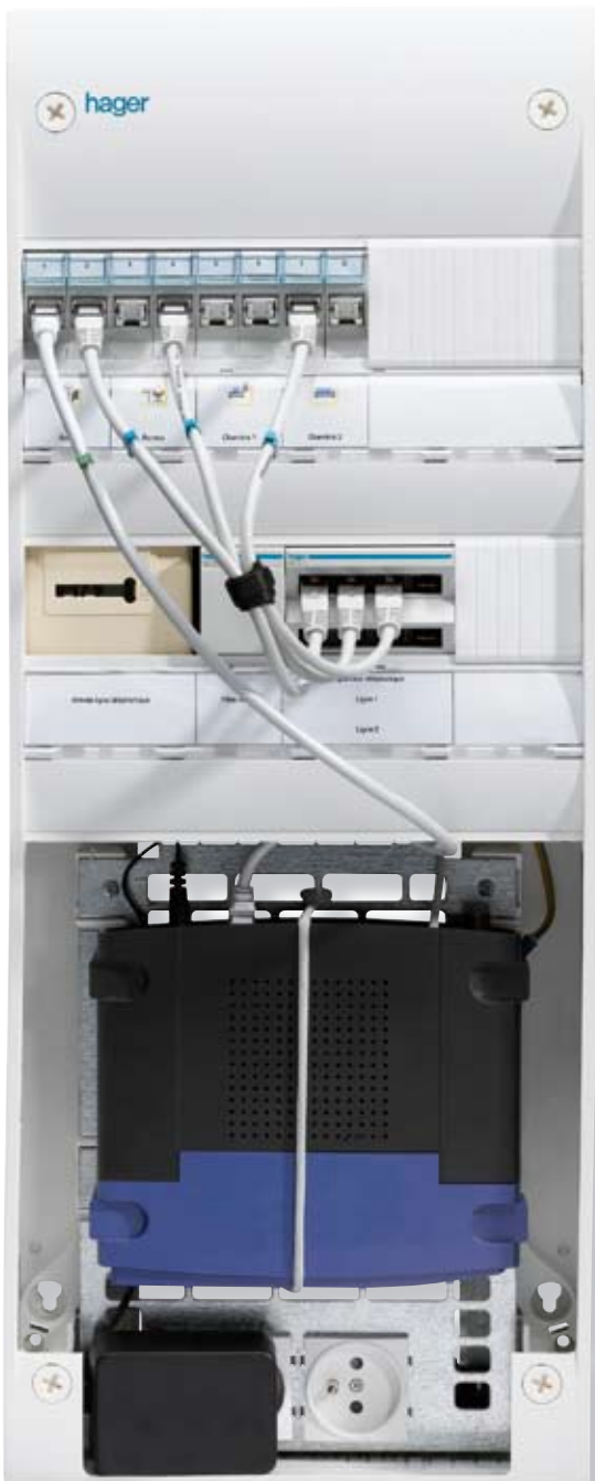
Le coffret de communication Nodeis, cœur de l'installation, concentre et diffuse l'ensemble des signaux (téléphoniques, informatiques et télévisuels) dans toute la maison.

La plupart des habitats s'avère mal adaptée à ces nouveaux services. L'une des composantes majeures de cette situation est notamment liée au câblage des logements. Prises téléphoniques (prises en T) et de télévision (prises coaxiales) se trouvent souvent mal placées et trop peu nombreuses au regard des nombreux services qu'elles sont en mesure de rendre.