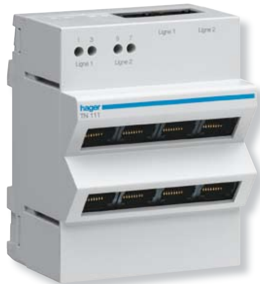
Gros plan sur le répartiteur téléphonique modulaire.

Par ailleurs, le format unitaire modulaire des connecteurs garantit la mise en œuvre du nombre exact de prises nécessaires.