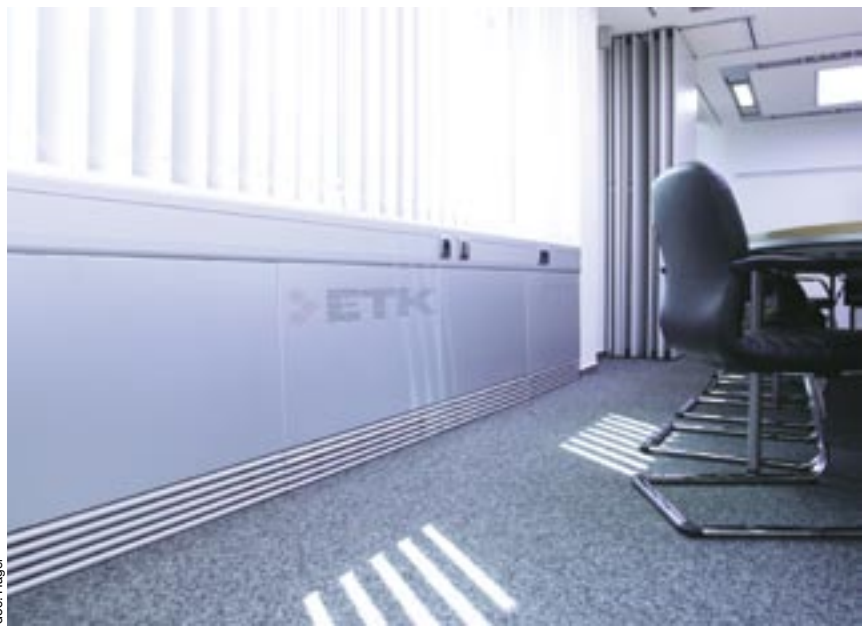
Caméléa de Tehalit donne de nouvelles formes aux goulottes qui prennent tous les aspects possibles et imaginables pour se fondre en toute discrétion dans le décor.

TEHALIT propose la colorisation des goulottes selon trois techniques :