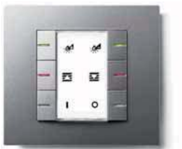
Tastsensor in kallysto.art