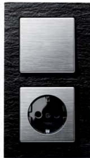
Rahmen kallysto.art Schiefer natur, 2-fach