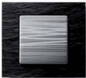
Wippe: Alu liniert