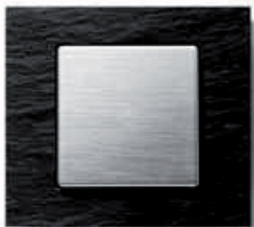
Wippe: Alu gebürstet