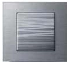
Alu natur gebürstet Alu liniert

Wippen: Thermoplast oder Echtmaterial (Aluminium)