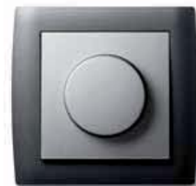
Drehdimmer in kallysto.stil

Das kallysto® Schalterprogramm wurde in enger Zusammenarbeit mit dem Elektro-fachhandwerk – also aus der Praxis für die Praxis – entwickelt. Daher erfüllt es höch-ste Ansprüche an Sicherheit, Zuverlässigkeit und Bedienungsfreundlichkeit. Wo Hager draufsteht, steckt beste Technik drin! Fragen Sie Ihren Elektrotechniker nach der idea-len Lösung für Sie. Er hilft Ihnen gerne bei der Planung und Ausführung.