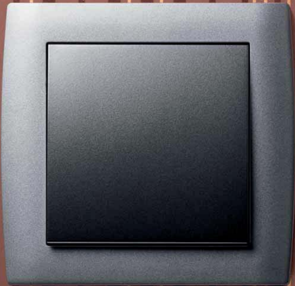
kallysto.stil, Rahmen und Wippe: Thermoplast silber/anthrazit