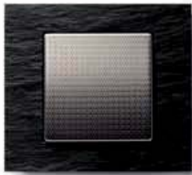
Wippe: Alu strukturiert

Gegensätze ziehen sich an. Manchmal genügt schon ein Blick, und es macht Klick – wie beim neuen kallysto.art Rahmen aus Naturschiefer und bei der Wippe im Aluminium Exclusiv-Design. Diese innovative Synthese verbindet das Raue mit dem Geschliffenen, das Dunkle mit dem Hellen, das Natürliche mit dem Raffinierten. Und sie verbindet Ihren guten Geschmack mit Hager – denn nur von uns bekommen Sie diesen Lichtblick!