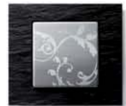
Schiefer natur Alu floral