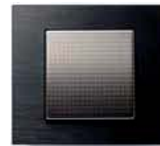
Alu anthrazit gebürstet Alu strukturiert