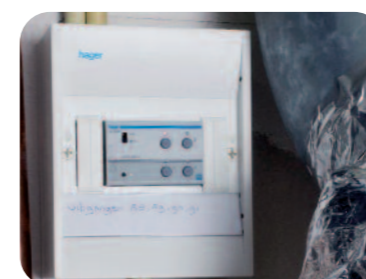
Integratie van E en W: op diverse verdelers van de vloerverwarming werd KNX-besturing aangesloten. Zo kunnen de servomotoren worden aangestuurd door het bussysteem.