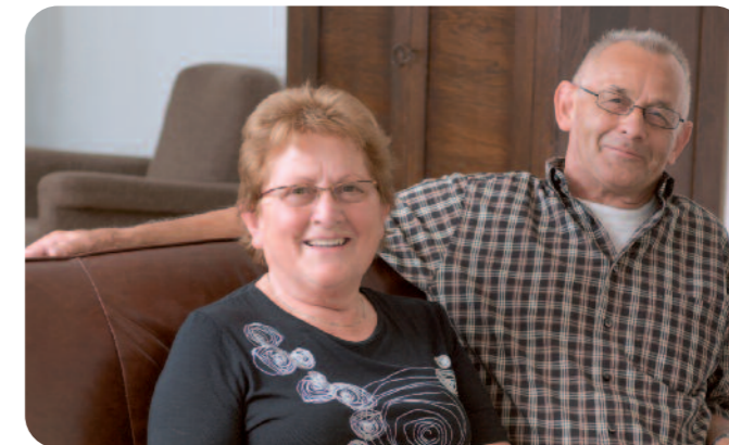
Een sterke eigenschap van KISS: met een universele installatie kunnen zeer individuele wensen van bewoners ingevuld worden.

De appartementen mogen met recht omschreven worden als individuele woningen. Er is geen sprake van eenvormigheid. De appartementen en penthouses verschillen wat betreft indeling en afmetingen, terwijl ook het aantal slaapkamers varieert. "Het motto van ons bedrijf is 'elkaar de ruimte geven'.