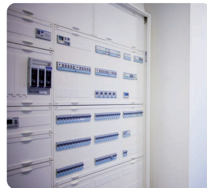
De verdeelinrichting – ook van Hager – vormt het hart van de gebouwautomatisering en mag van itsme best worden gezien. De kast staat stoer en opvallend in de schijnwerpers in de entree van het pand, waardoor hij bij binnenkomst niet te missen is.

Uitgebreide projectbeschrijvingen Kijk op www.hager.nl/projecten