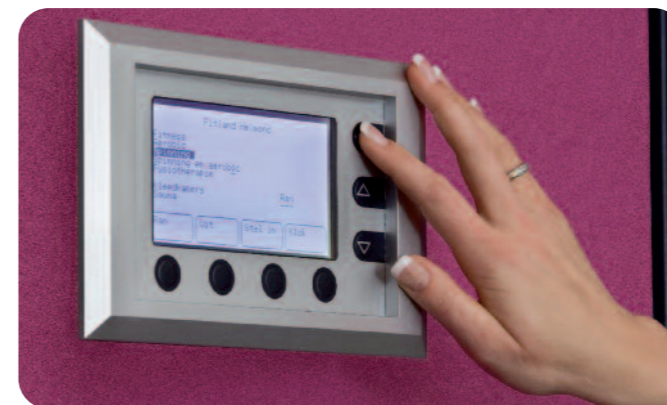
Voor de centrale bediening van de installaties bij de receptie leverde Hager een lcd-scherm. Met enkele knoppen is de verlichting en de klimaatinstallatie in alle ruimten van het centrum aan te sturen, door alle collega's.