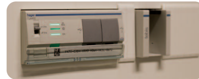
Het belangrijkste voordeel is de eenvoud: je koopt een keer een kleine server, koppelt hem aan het netwerk en aan het bussysteem en je kunt op elke computer in het gebouw de installatie visualiseren.