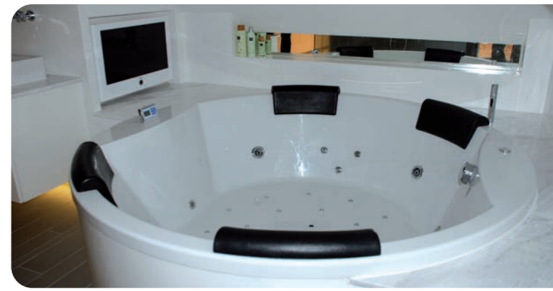
"Mensen die enthousiast worden van een jacuzzi in hun badkamer, een nieuwe stoomoven of een groot kookeiland, kunnen dat ook worden van hun elektrotechnische installatie en domotica-installatie."