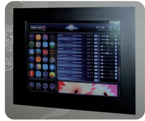
Het zelf ontwikkelde bedieningspaneel van Meerdan, een touchscreen met symbolen, zodat de bediening intuïtief en eenvoudig is.