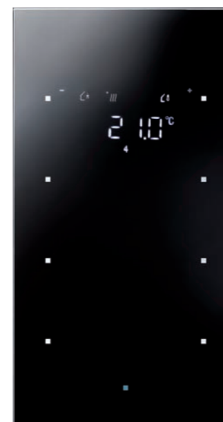
TS-Sensor met temperatuuraanduiding

Gekozen is voor KNX-gebouwautomatisering, om het gebouw qua bediening en monitoring zo gebruiksvriendelijk mogelijk te maken. "Onze keuze viel op Berker, omdat wij met hen al veel goede ervaringen hebben. Zij bieden een ruime keuze aan componenten die op basis van KNX werken. Daarnaast, en dat was minstens zo belangrijk, hebben zij productseries die in sterke mate bijdragen aan gebruiksvriendelijkheid en design."