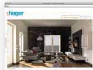
Erleben Sie Elektrotechnik in Aktion!