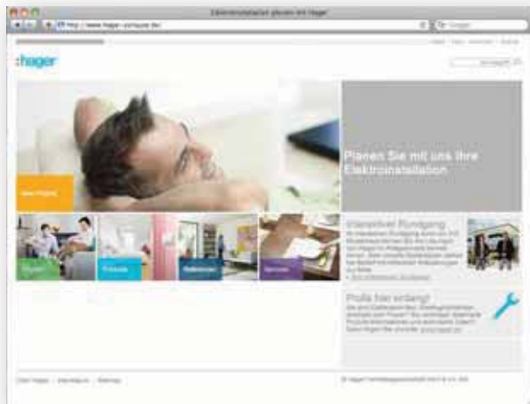
Ganz entspannt zum Wunsch-Zuhause mit www.hager-zuhause.de

ELEKTROMEISTER GESUCHT? So sind Sie bestens gerüstet für das Erstgespräch mit Ihrem Elektrofachmann und können die für Sie optimale Lösung mit ihm entwickeln. Wenn Sie noch auf der Suche nach einem Fachunternehmen sind, kann Ihnen die Webseite auch hier weiterhelfen! Aus einer umfangreichen Datenbank sucht der Elektromeister-Service Ihnen alle für Ihr Vorhaben geeigneten Elektrofachbetriebe in Ihrer Umgebung heraus. So finden Sie auf www.hager-zuhause.de von der ersten Idee bis zur Umsetzung interaktive Rundumbetreuung – und Sie müssen dafür nicht einmal Ihr Wohnzimmer verlassen!