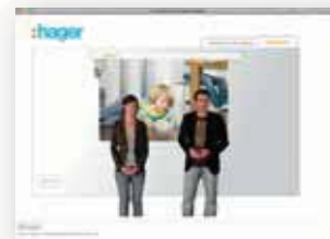
Das Hager Moderatoren-Team hilft Ihnen bei Ihrer Planung.