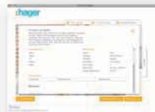
Schritt für Schritt zu Ihrer individuellen Projektliste.

Alle Elektrofachbetriebe in Ihrer Umgebung!