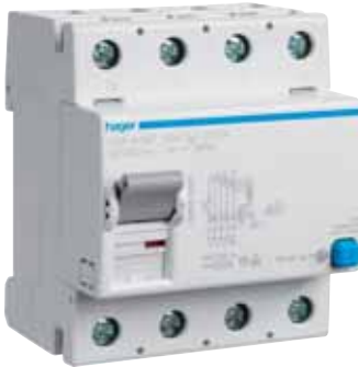
Abbildung 3: Allstromsensitiver FI-Schutzschalter

Dabei ist anzustreben, dass der Bemessungsfehlerstrom, wie bisher üblich, den Schutzpegel kennzeichnet, der mit dieser Fehlerstrom-Schutzeinrichtung zu erzielen ist.