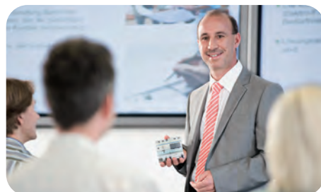
Aus der Praxis für die Praxis: die Workshops