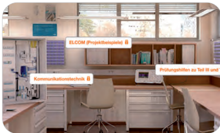
Komplexes Wissen anschaulich vermittelt: das Trainingslager