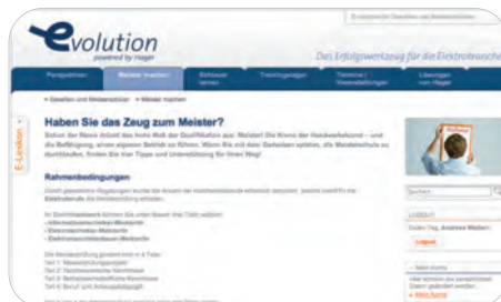
Meisterliches Know-how für Gesellen: das Informationsangebot