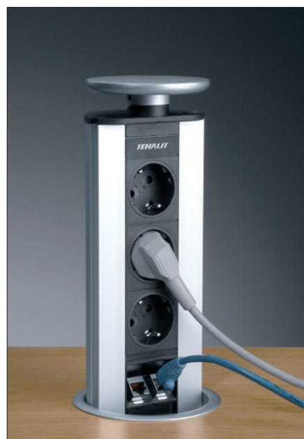
Obr. 4. Vestavný zásuvkový sloupek se 3 zásuvkami 230 V a dvojitou zásuvkou pro přenos dat