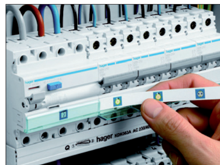
Obr. 3. Jednoduché a rychlé označení přístrojů pomocí popisovacího štítku s průhledným krytem

popis jednotlivých přístrojů prostřednictvím popisových štítků a etiket. S využitím Semiologu lze štítky pro označení obvodů navrhnout a vytisknout. Štítky působí velmi esteticky, ale zároveň jsou i praktické. Pro tvorbu štítků je možné volit z řady barevných i čer-