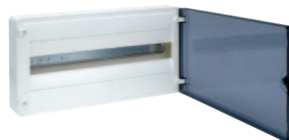
■ Obr. 3

denácti různých velikostech skříní od 4 do 72 modulů. Za zdůraznění stojí především jednořadý rozvaděč s 22 moduly, který při montáži nad vchodové dveře nabízí více prostoru pro modulové přístroje než srovnatelné výrobky (obr. 3).