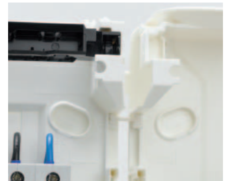
■ Obr. 11

šroubů. Pro zajištění ochrany se otvory pro upevnění zakryjí uzávěry z umělé hmoty. Velice praktické je použití distančních držáků při montáži více skříní. Je možné skříně srovnat visle a vodorovně jako celek (obr. 11).