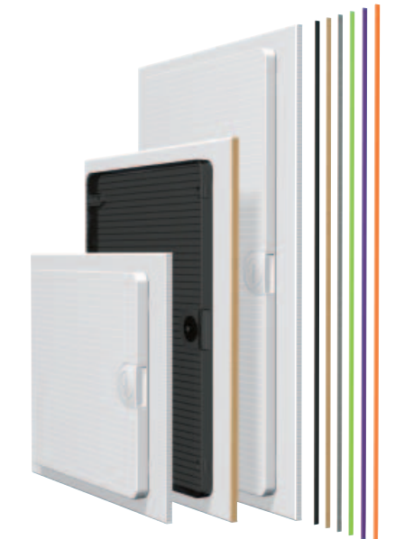
■ Obr. 13

Nová Golf-generace nepřesvědčuje jen po technické stránce, ale líbí se také vizuálně. Povrch dvířek, které jsou k dodání buď v bílé barvě nebo průhledné, je v elegantním designu (obr. 12). Pro zapuštěnou montáž nabízí Hager samolepící dekorační proužky v deseti různých barvách a vzorech, aby bylo možno vytvořit harmonický soulad k nejrůznějším úpravám a vzhledu stěn (obr. 13).