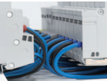
■ Obr. 7