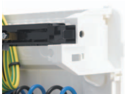
■ Obr. 9

(obr. 7). Tyto DIN lišty jsou předvrtány pro montáž do skříně vedle krajních modulů (obr. 8). Tak je upevnění zpřístupněno i tehdy, když jsou moduly namontovány mimo rozvaděč. Rovněž praktické upevnění svorkovnice PE/N do držáku umožňuje rychlou montáž bez časově náročného šroubování (obr. 9). Bezproblémově je řešeno také zavedení kabelů: elektrotechnikům usnadňuje práci vyjmutelná příruba a na spodní straně skříně předznačené otvory k vylovení. Mezi další přednosti nové GOLF-generace patří následující inovace: kryt a dvířka se upevňují šroubem s pootočením o 90° (obr. 10), transparentní popisovací štítky dodávají výrobku profesionální vzhled a dvířka lze chránit před neoprávněným otevřením klíčkem z příslušenství. Navíc na každé skříní jsou montážní přednosti ilustrovány tak, aby je každý elektrotechnik mohl využít (obr. 6).