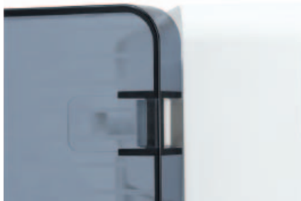
■ Obr. 2

Společně s mottem „Inovace z inspirace“ Hager představuje svoji zcela novou rozvodnici GOLF. Skříň byla vytvořena v úzké spolupráci s odborníky z elektrobranže tak, aby optimálně splňovala požadavky praxe pro snadnou, kvalitní a čistou montáž. Nový Golf je k dodání ve dvou provedeních: pro nástěnnou i zapuštěnou montáž. Verze pro zapuštěnou montáž splňuje požadavky testu žhavou smyčkou 850 °C a proto je vhodná pro montáž do du-