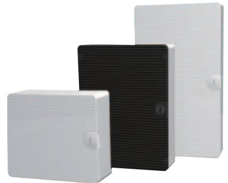
■ Obr. 12