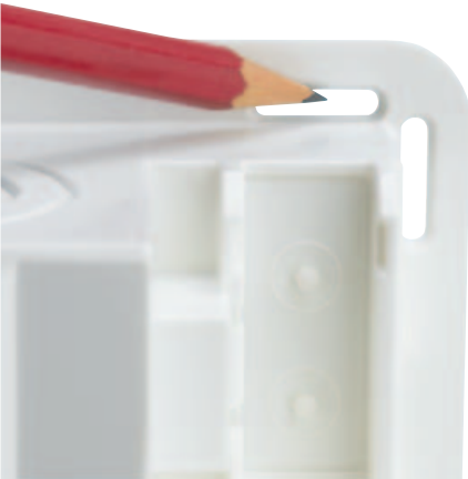
■ Obr. 4