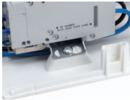
■ Obr. 8

(obr. 7). Tyto DIN lišty jsou předvrtány pro montáž do skříně vedle krajních modulů (obr. 8). Tak je upevnění zpřístupněno i tehdy, když jsou moduly namontovány mimo rozvaděč. Rovněž praktické upevnění svorkovnice PE/N do držáku umožňuje rychlou montáž bez časově náročného šroubování (obr. 9). Bezproblémově je řešeno také zavedení kabelů: elektrotechnikům usnadňuje práci vyjmutelná příruba a na spodní straně skříně předznačené otvory k vylovení. Mezi další přednosti nové GOLF-generace patří následující inovace: kryt a dvířka se upevňují šroubem s pootočením o 90° (obr. 10), transparentní popisovací štítky dodávají výrobku profesionální vzhled a dvířka lze chránit před neoprávněným otevřením klíčkem z příslušenství. Navíc na každé skříní jsou montážní přednosti ilustrovány tak, aby je každý elektrotechnik mohl využít (obr. 6).