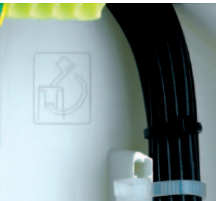
■ Obr. 6