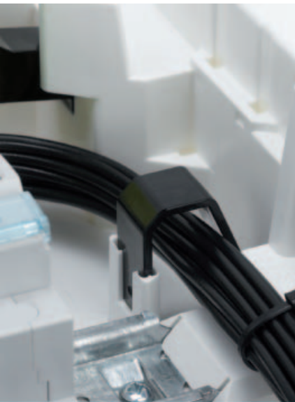
■ Obr. 5