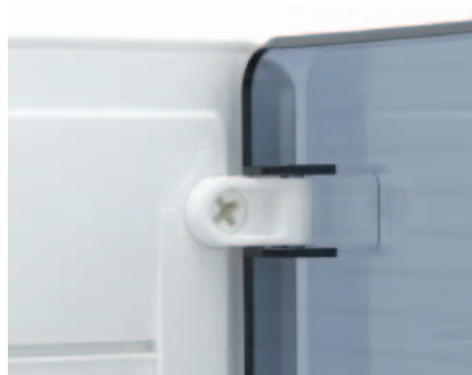
■ Obr. 10

Kromě výše zmíněných výhod všech nových GOLF-rozvaděčů varianta pro nástěnnou montáž navíc nabízí tato zlepšení. Rozvodnice pro nástěnnou montáž se upevní na zeď nejprve pomocí centrálně umístěného šroubu. Poté může elektrikář srovnat rozvaděč pomocí vodorovky a nakonec zafixovat pomocí čtyř dalších