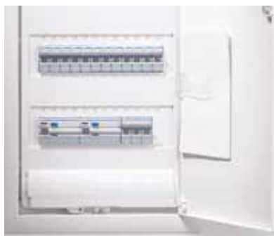
Obr. 3 Vnitřní strana dvířek je vybavena příchytkou na plány

jsou garancí jednoduché a rychlé montáže. Nová řada je však vedle známých vlastností též výrazně prostornější, protože vnitřní prostor skříně byl zvětšen o 30 %. Pro usnadnění přesného zazdění je přímo ve skříně integrována vodováha (obr. 2), nový je systém příchyttek pro upevnění do sádko-kartonu, příchytka na plány (obr. 3) a řada dalších technických novinek.