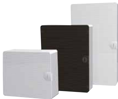
Obr. 1 Rozvodnice golf

Bezproblémovou montáž do dutých příček umožňují patentované rychloupínací příchytky se šrouby, které při montáži nevy-