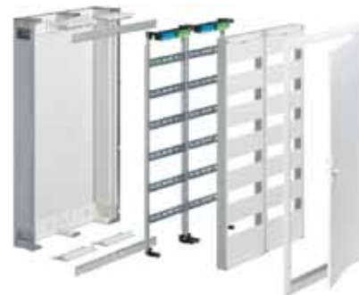
Obr. 4 Konstrukce skříně univers FW pro zapuštěnou montáž

Firma Hager má kromě známých rozváděčových skříní řady univers FW ve svém produktovém portfoliu rovněž skříně univers FW určené výhradně pro zapuštěnou