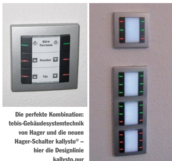
Die perfekte Kombination: tebis-Gebäudesystemtechnik von Hager und die neuen Hager-Schalter kallysto® – hier die Designlinie kallysto.pur

kallysto® überzeugt zudem durch seine Montagefreundlichkeit: Front-Check-Prüfkontakte erlauben die Messung und Fehlersuche im eingebauten Zustand. Die geringe Einbautiefe lässt ausreichenden Platz für Leitungen und Klemmen. Komplett versenkbare Befestigungskralen verhindern eine Verletzungsgefahr, und